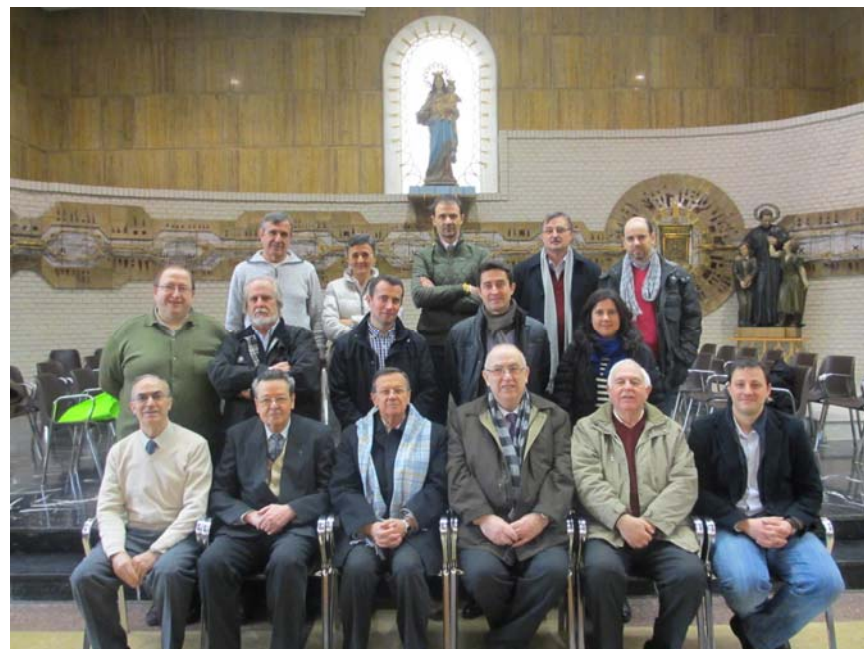
Foto de grupo de los asistentes a los Consejos Regionales de este año 2013 de la Fed.Regional de AA.AA.DB. Madrid

Federación Regional de AA.AA.DB. de la Inspectoría Salesiana de Madrid