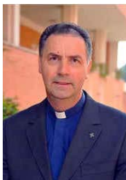
Rector Mayor P. Ángel Fernández Artime, fue elegido por el XXVII Capítulo General, el día 25 de marzo de 2014. Es el X Sucesor de Don Bosco.

El Aguinaldo es ofrecido por el Rector Mayor como sucesor de Don Bosco y como padre de toda la Familia Salesiana y representa un incentivo más para conocer y vivir con un objetivo colectivo, que es la puesta en común de la misión salesiana al servicio de los jóvenes, especialmente los más pobres.