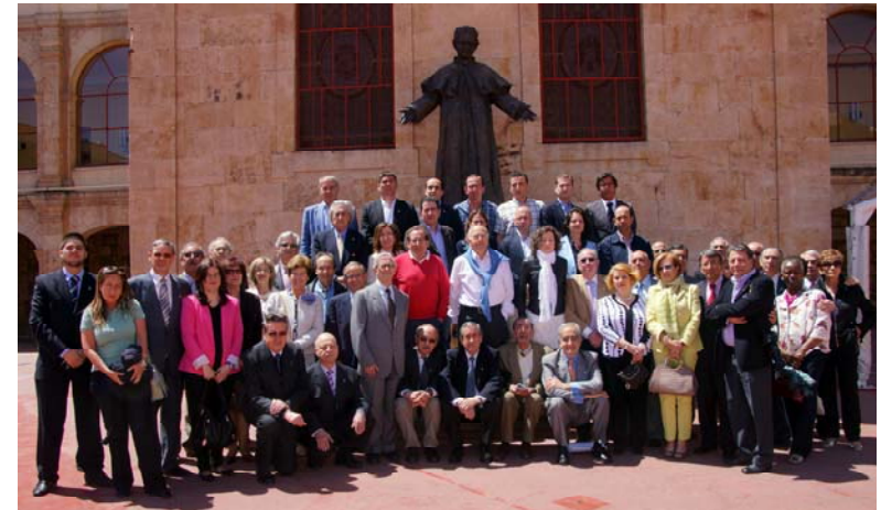
Fotografía de grupo el domingo 12 de mayo, tras la Eucaristía y renovación de la Imposición de Insignias

Más de 50 personas disfrutaron del fin de semana compartiendo recuerdos, anécdotas, y agradecimiento por la educación recibida.