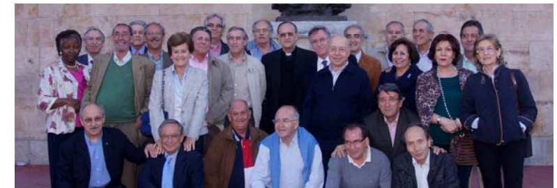
Grupo de la Promoción 1962/63