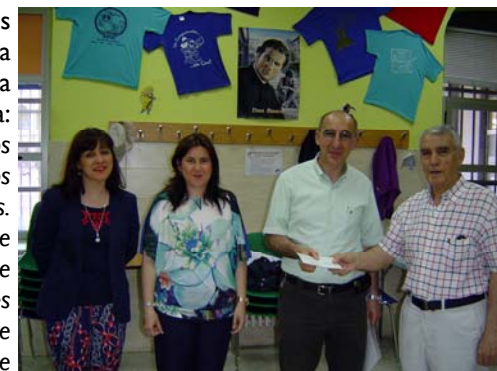
La Coordinadora de CACE y la Presidenta junto al Director del Centro Juvenil que recibe nuestra aportación por el Tesorero.

La continuidad del proyecto, es una preocupación constante para el Centro Juvenil, ya que la estiman totalmente necesaria: "Tenemos contacto con 12 centros escolares de Salamanca, desde los que les derivan chicos y chicas. Atendemos a un buen número de chicos y chicas entre los que destacan un 80% de inmigrantes por lo que es necesaria y deseable su continuidad ya que pretende cubrir los vacíos de nuestro actual sistema educativo, prestando especial atención a los jóvenes más desfavorecidos. Todos aquellos chicos y chicas que participen activamente en nuestro programa podrán integrarse de forma normal a nivel social, escolar, personal y familiar."