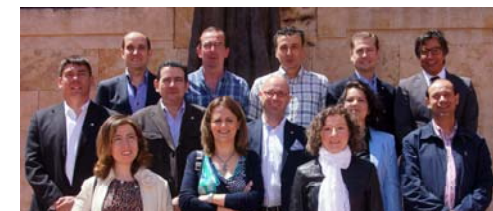
Promoción de 1987/88