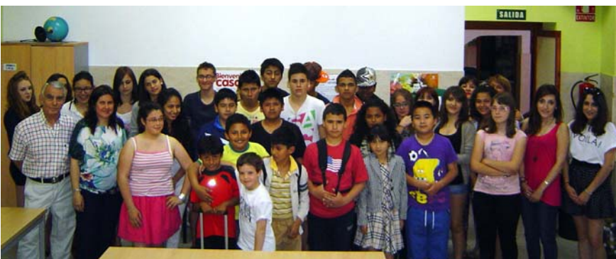
Presidenta y Tesorero con los chicos y monitores del Centro Juvenil en "Apoyo a CACE"

Distintos centros escolares de toda Salamanca, así como Servicios Sociales y otras instituciones, derivan estos chicos que necesitan un seguimiento y refuerzo educativo, y con los que se trabaja en integración social, evitando su caída en la exclusión y previniendo situaciones de riesgo. Se desarrollan acciones de apoyo al estudio, desarrollo de habilidades sociales, mejora de la confianza y la autoestima así como actividades de ocio y tiempo libre.