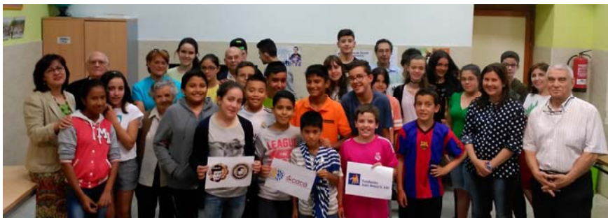
Presidenta y Tesorero con los chicos y monitores del Proyecto CACE y el Director del Centro Juvenil

ha concedido a este proyecto de nuestra Asociación de Antiguos Alumnos y el Centro Juvenil. Más de 40 chicos se han beneficiado de este proyecto.