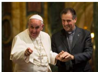
El Papa junto al Rector Mayor