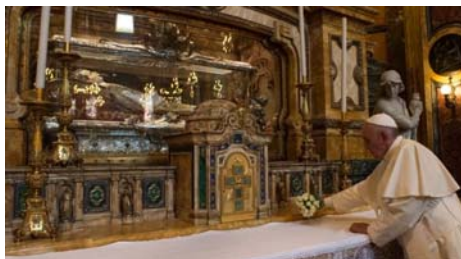
El Papa orando ante la urna de D.Bosco en la Basílica de Turín

Hablando de Mamá Margarita ("sin ella no se puede entender a Don Bosco"), el Santo Padre habló sobre el papel de las mujeres y los modelos educativos femeninos que se deberían proponer a las jóvenes, las alumnas de los Salesianos y de las Hijas de María Auxiliadora. No funcionalismo de los roles, sino una educación de acuerdo con modelos fidedignos de las mujeres que saben amar, fue la