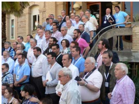
Asistentes al Consejo Nacional 2015