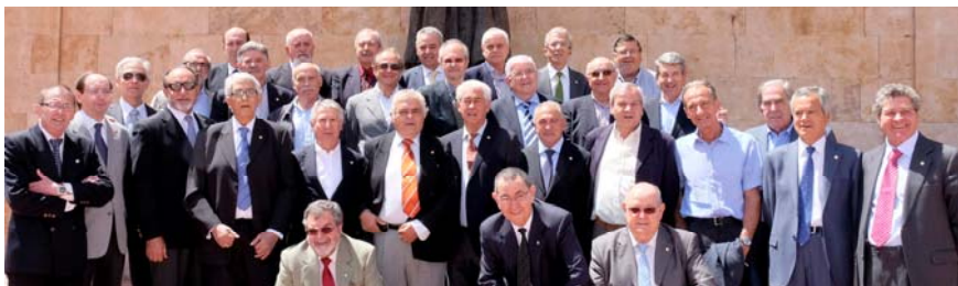
Grupo de la Promoción 1964/65