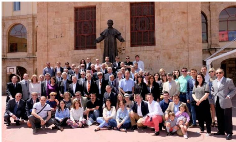
Fotografía de grupo el domingo 10 de mayo, tras la Eucaristía y renovación de la Imposición de Insignias

Más de 80 personas disfrutaron del fin de semana compartiendo recuerdos, anécdotas, y agradecimiento por la educación recibida.