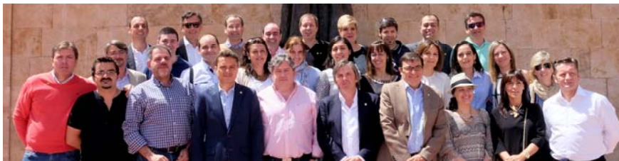
Grupo de la Promoción 1989/90