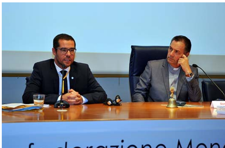
El nuevo Presidente Mundial, Michal Hort, junto al Rector Mayor